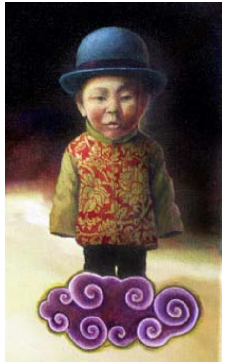
Detalle de “La Nube de I Ming”.

FAMILASIA es la continuación de “El fantástico vuelo del Hombre Cometa”, una exposición que pudo verse en cantidad de salas españolas, entre ellas el Museo de Albacete. En “el fantástico vuelo...” yo mismo interpretaba al hombre cometa, Blinky Rotred, un personaje que hacía todo lo posible para volar y que contaba con todos sus amigos (mis amigos) y con su amada Beatrice (mi amada) para el desarrollo de tal proeza. Pues bien, una vez cometido tal deseo, Blinky y Beatrice vuelan a FAMILASIA, la Isla de los virtuosos, para conocer a la familia de ésta, que son, los familiares reales de mi mujer. Es un homenaje directo a esta peculiar y pintoresca familia, pero también un canto a la “familia” como ente social y universal. Un paseo por la ventana del arte, donde la imaginación convive con la realidad de una forma armónica y emocionante. Los personajes reales simplemente están aderezados con algo de fantasía, amplificando sus cualidades, pero respetando la naturaleza de cada uno de ellos. Cumplen quizá, arquetipos universales, donde podemos reflejar parte de nosotros mismos. Cada retrato, es un pequeño universo perteneciente a un universo mayor: La Familia. FAMILASIA. ■