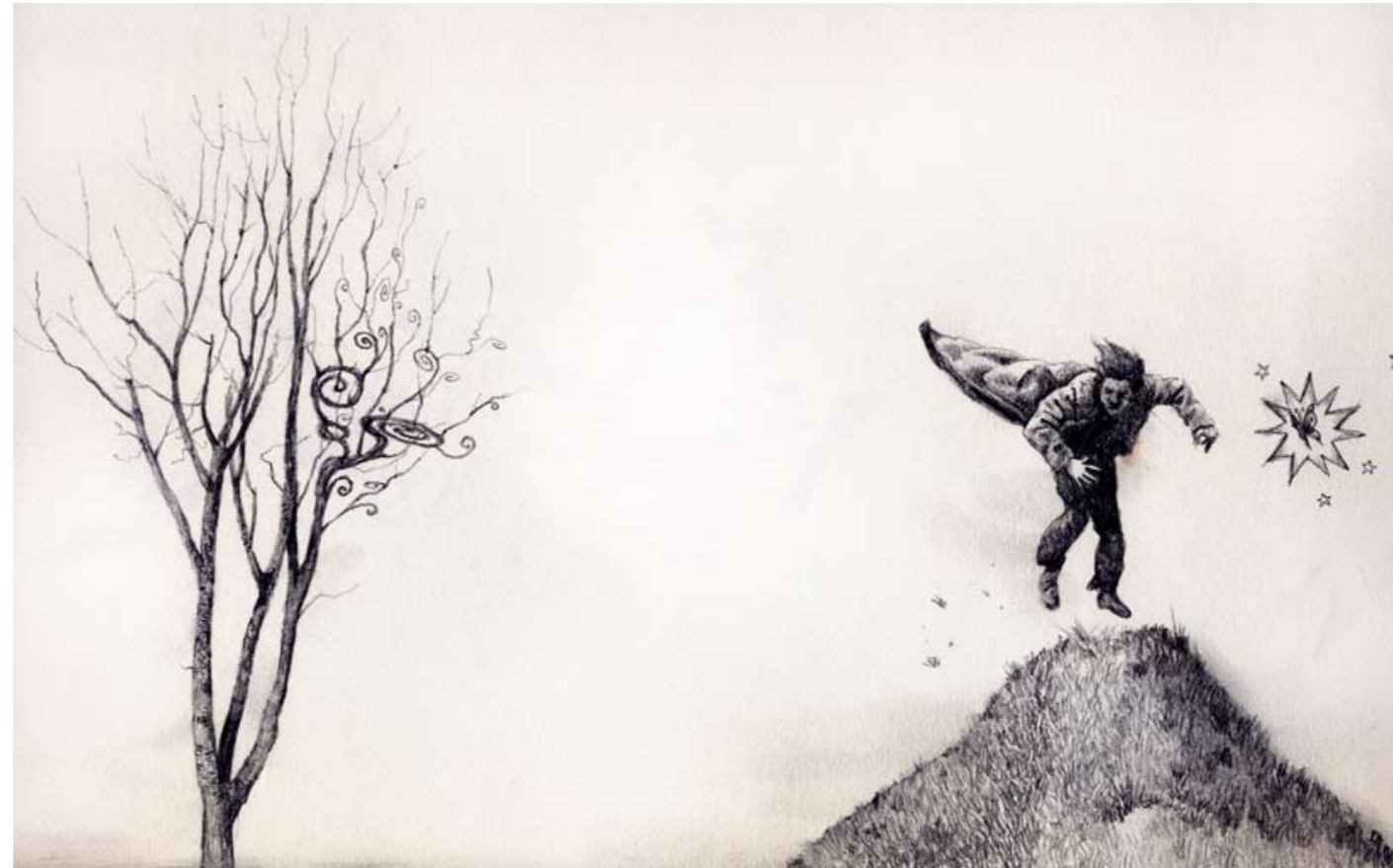
“Árbol y viento Fábula” (sup.) “TheWelcome cabeza niño” (inf.)

Creo que el publico, el espectador, es tan importante como el artista; sin él, no hay arte ni artista, habrá algún tipo de auto-realización o terapia u otra cosa, pero no lo que entiendo yo como arte. El arte se produce en el encuentro con “el otro”, tu “yo” proyectado, al igual que el ser humano necesita de otro semejante para saber quien es él mismo. Los artistas están muy lejos del público y es con la responsabilidad de la que hablo, la que quizá pueda solucionar este tema. Y no propongo hacer “arte para la masa”, simplón, vacío y kitch, sino hacer un arte sincero desde el corazón, pues a ese nivel, son muchas más cosas las que nos unen, de las que nos separan. Aunque para que este acercamiento suceda, una parte de ese trabajo →