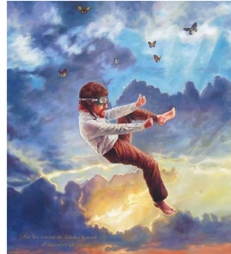
“Blinky Rotred, el hombre cometa” (sup.)